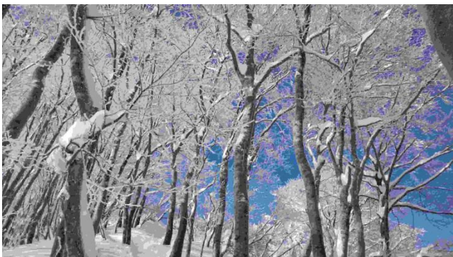
シャクナゲ平もうすぐ

頂上に行くに従い、ガス濃く風も強まる、先行していた人とラッセルを交代しながら頂上着、風強く展望もないため、即下山、シャクナゲで昼食をとり、踏み固められた雪道を小走りで下りた。