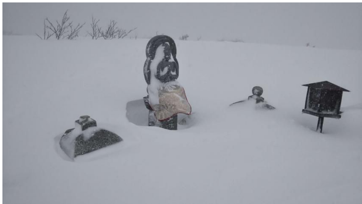
頂上の大日如来様